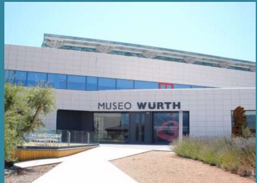
Museo Würth, La Rioja