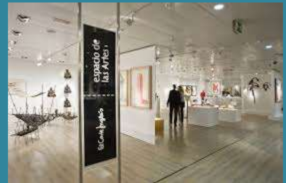
Espacio de las Artes, El Corte Inglés, Madrid