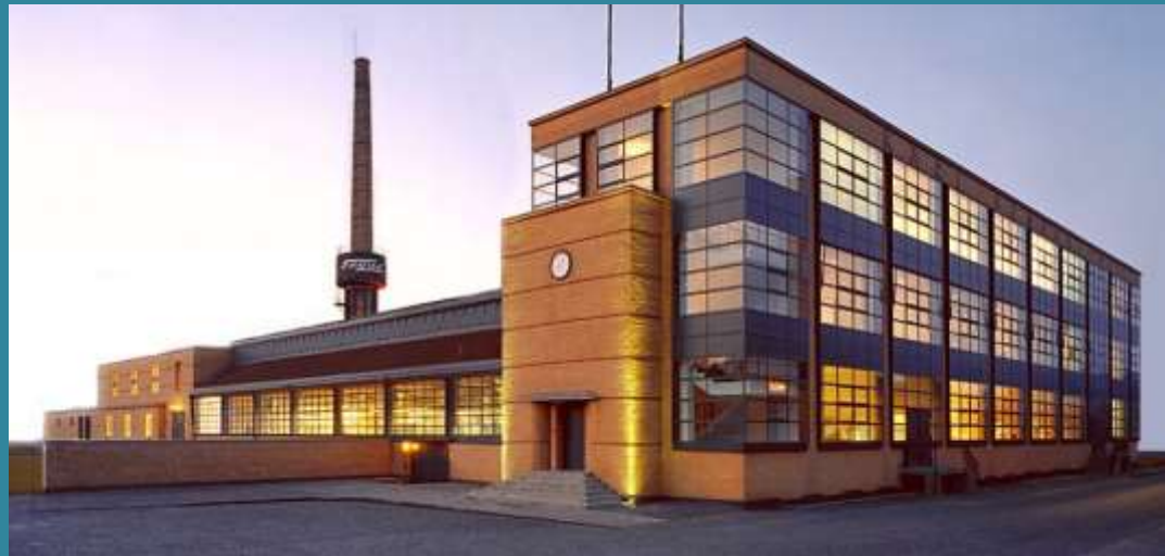
Walter Gropius: Fábrica Fagus, Alfeld an der Leine, Baja Sajonia, Alemania