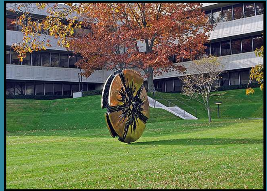
Wheel, Pepsico Sculpture Gardens, Westchester, NY.