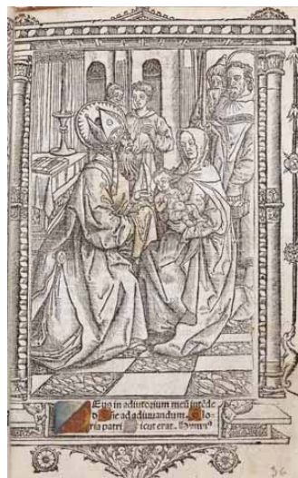
12.- Presentación de Jesús en el Templo. Libro de horas . IB. 6570, f. 36r.