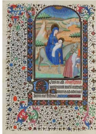
14. Huida a Egipto. Libro de horas de Margarita de Borbón. RB. 6, f. 70v.