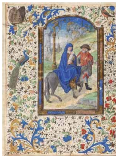
24.- Huida a Egipto. Hoja suelta de libro de horas. IM. 3035.