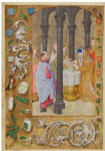
11.- Circuncisión. Libro de horas de William Hastings . IB. 15503, f.117v.