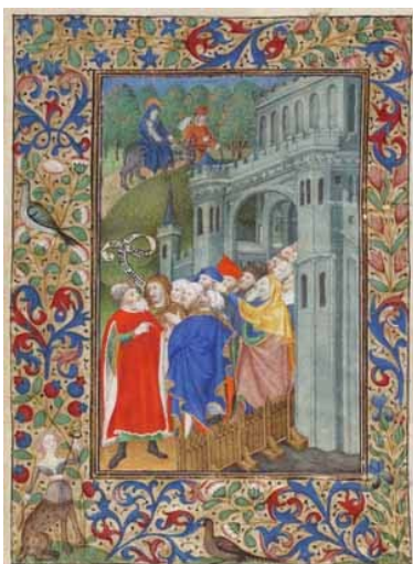
25.- Huida a Egipto. Hoja suelta de libro de horas. IM. 2699.