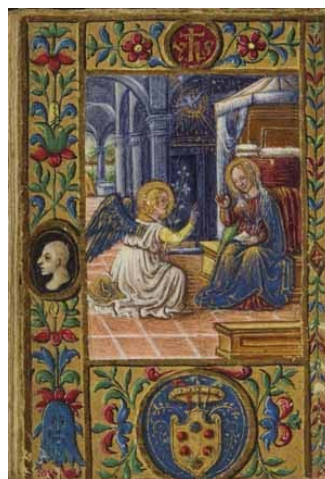
4. Anunciación. Libro de horas de los Médicis. IB. 15512, f. 22v.