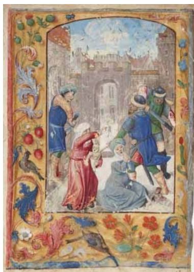
23.- Matanza de los Inocentes. Hoja suelta de libro de horas. IB. 15288-59.