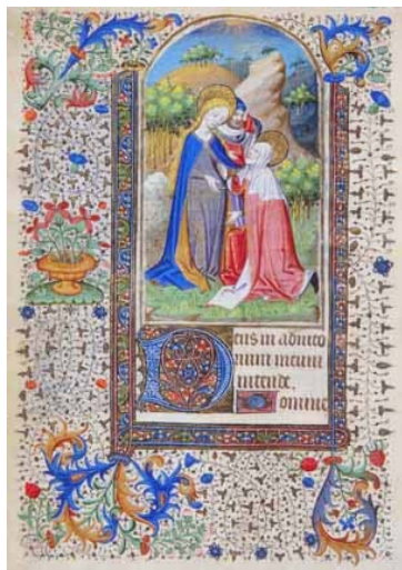
5.- Visitación. Libro de horas de la Virgen Tejedora. IB. 15452, f. 46v.