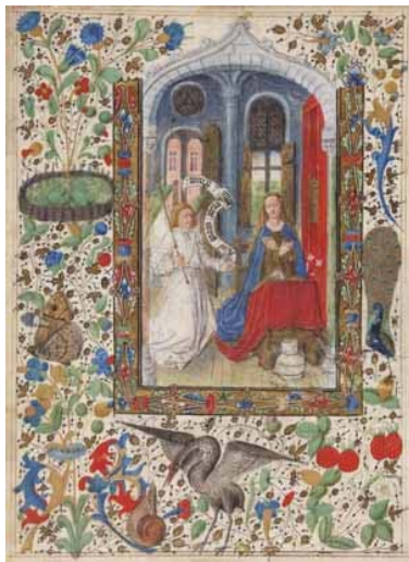
19.- Anunciación. Hoja suelta de libro de horas. IM. 3036.