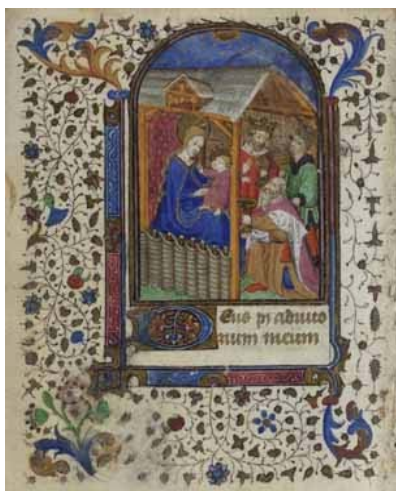
9.- Adoración de los Reyes Magos. Libro de horas . IB. 15511, f. 70v.