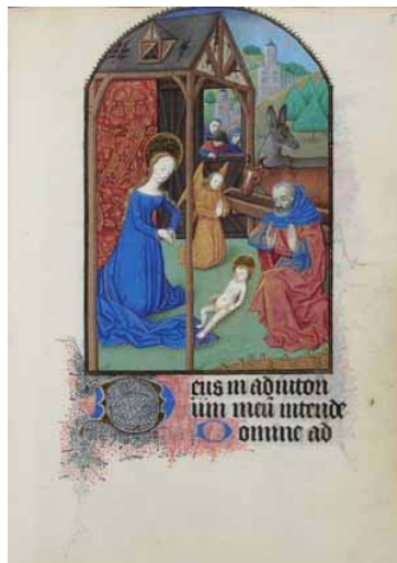
6.- Nacimiento de Jesús. Libro de horas. RB. 14429, f. 51r.