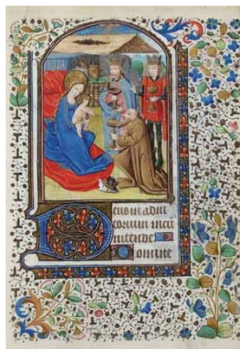
10.- Adoración de los Reyes Magos. Libro de horas . RB. 7, f. 57r.