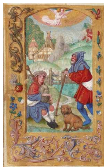
8.- Anuncio a los pastores. Libro de horas, fragmento IB. 15494, f. 1v.