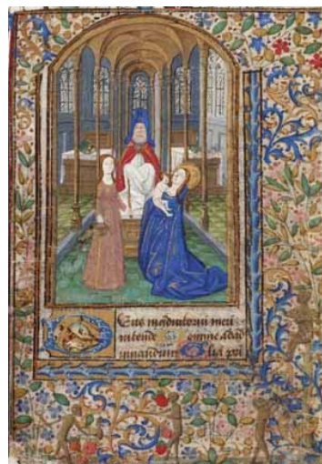
26.- Presentación de Jesús en el Templo. Hoja suelta pegada en un Misal . IB. 15492, f. 257v.