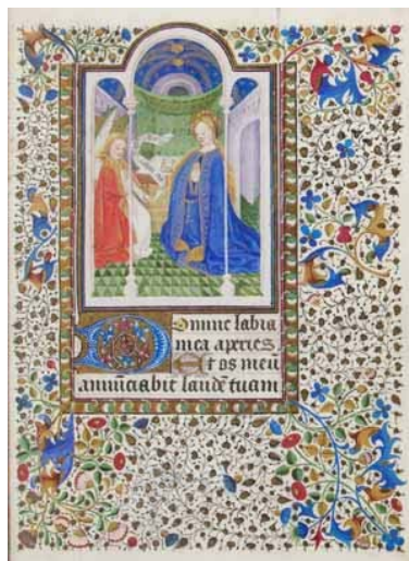
2. Anunciación. Libro de horas. IB. 15446, f. 24r.