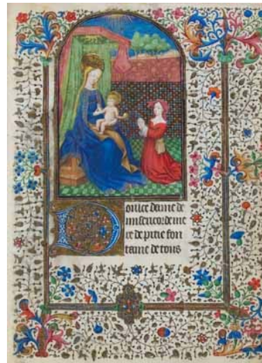
16.- Virgen con el Niño. Libro de horas, fragmento. IB. 15450, f. 1r.