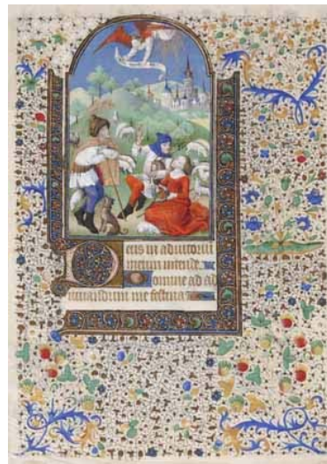
20.- Anuncio a los pastores. Hoja suelta de libro de horas. IB. 15288-37.