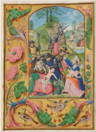
13.- Matanza de los inocentes. Libro de horas de Madama Lázaro. IB. 15517, f. 73v.