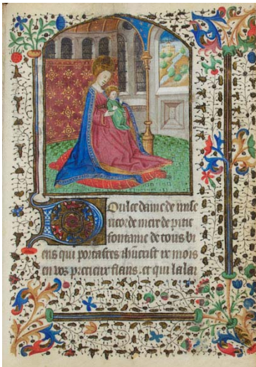
15.- Virgen con el Niño. Libro de horas. IB. 15502, f. 102r.