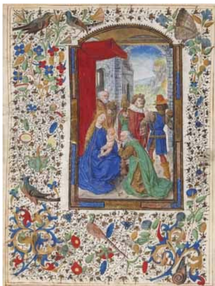
21.- Adoración de los Reyes Magos. Hoja suelta de libro de horas. IM. 3039.