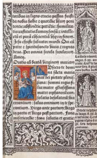
18.- Virgen con el Niño. Libro de horas. IB. 15507, c 3r.