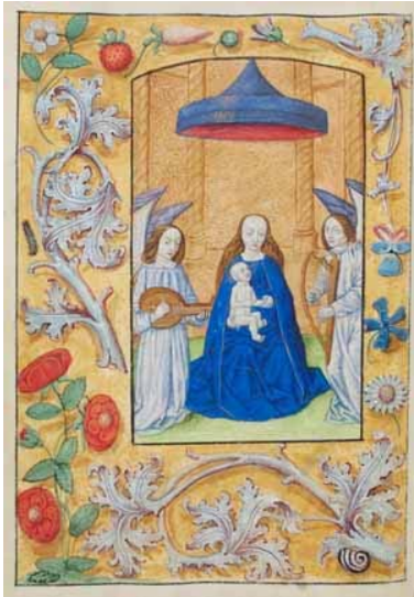
17.- Virgen con el Niño. Libro de horas. IB. 15520, f. 28v.