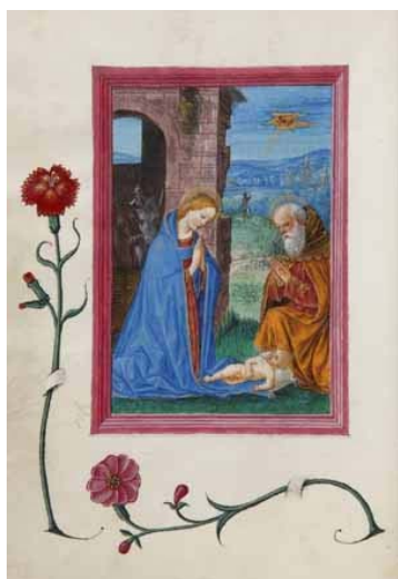
Nacimiento de Jesús. Libro de horas de Gian Giacomo Trivulzio. IB. 15454, f. 70v.