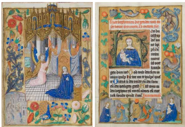
1. Anunciación, Visitación, Nacimiento de Jesús, Adoración de los Reyes Magos y Virgen con el Niño. Libro de horas. IB. 15656, f. 13v.-14r.