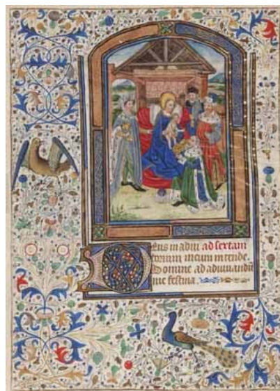
22.- Adoración de los Reyes Magos. Hoja suelta de libro de horas. IM. 2766.