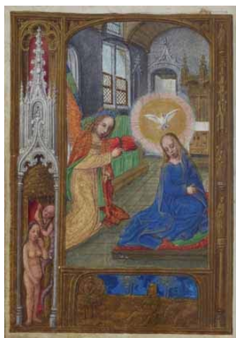
3.- Anunciación. Libro de horas. IB. 15516, f. 29v.